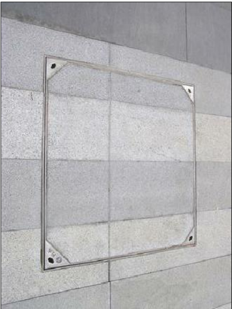
5 示意图 NTS.