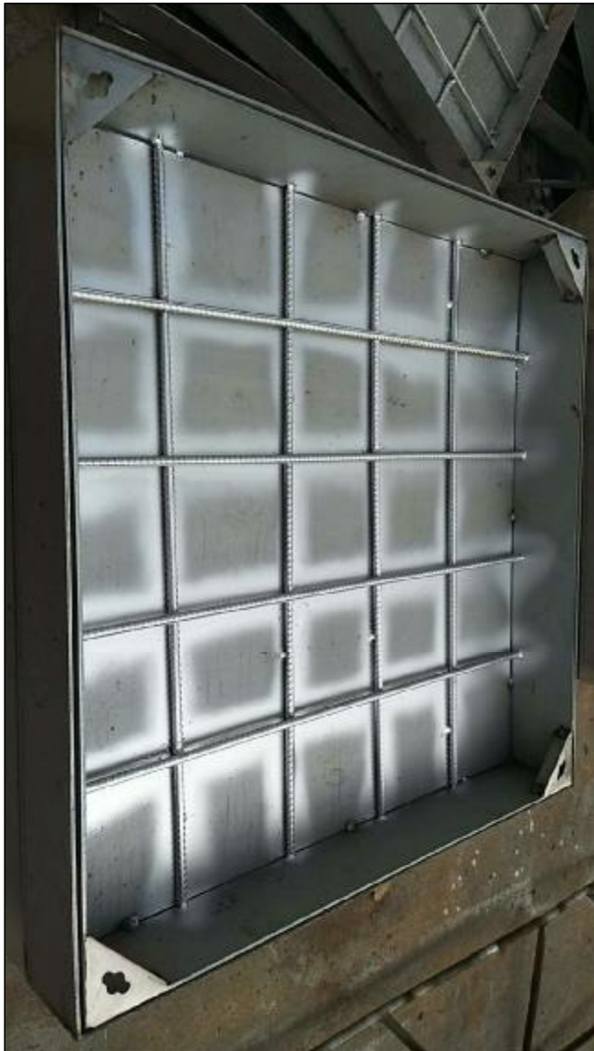
6 示意图 NTS.