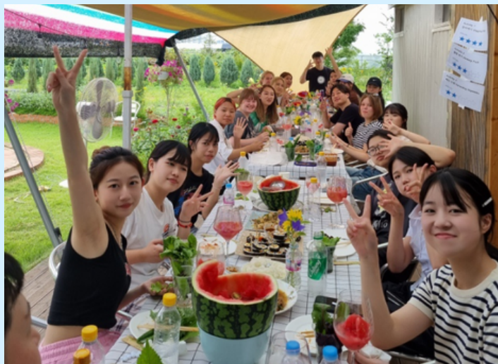
韩国传统游戏体验